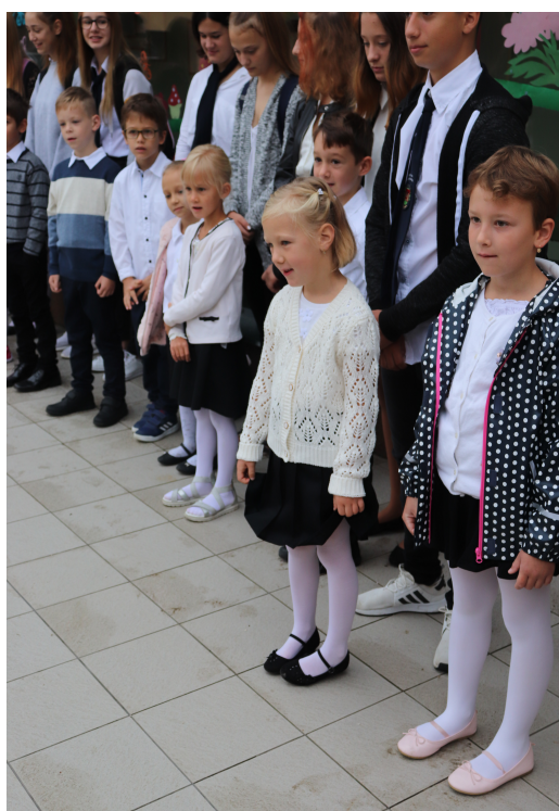
A Vajda János Általános Iskola Eseménynaptára